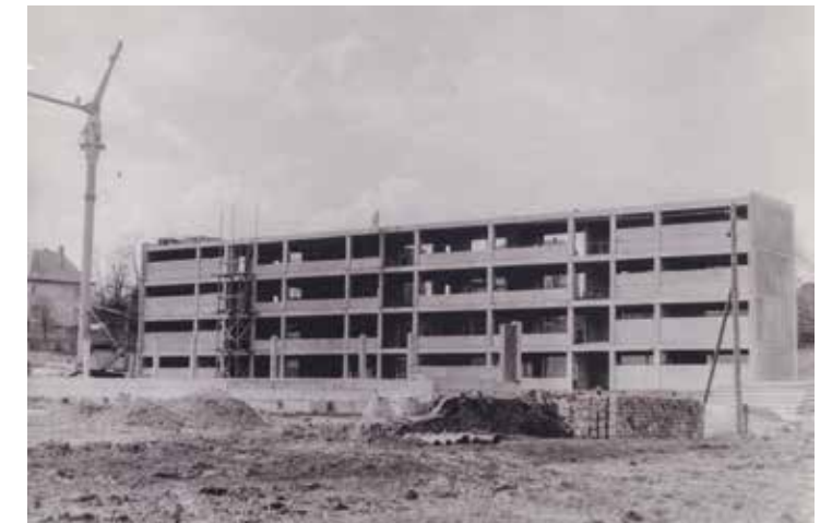
Schule im Rohbau 1967

Den Abschluss der Festwoche gestaltet die internationale Künstlergruppe „INSTANT ACTS“ . Nachdem die aus 13 verschiedenen Ländern stammen-